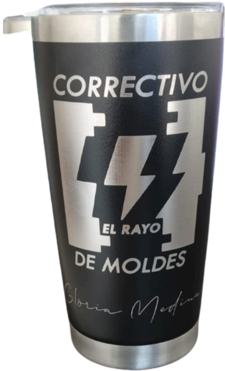
NOMBRE + LOGO